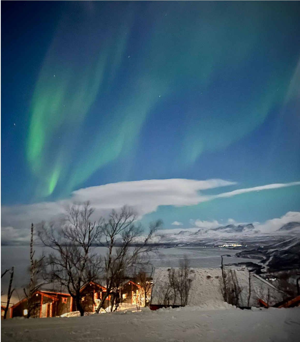
Hotel Fjället in Björkliden bei Nacht mit Polarlichtern