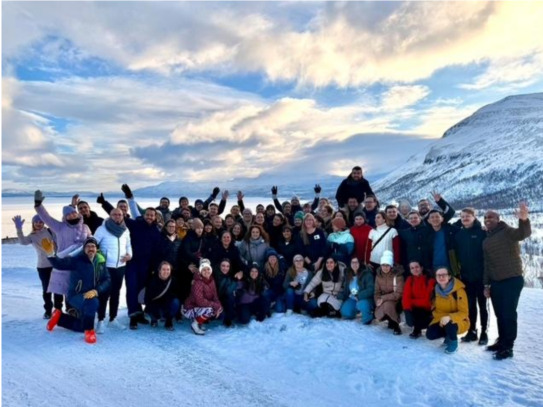
Gruppenbild der EFIM Winter School 2025